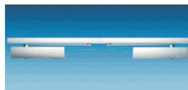
TS 3000 ISM