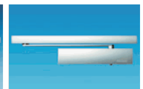
TS 3000 E