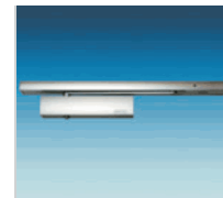
TS 3000 R